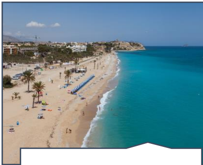
Sol y playa