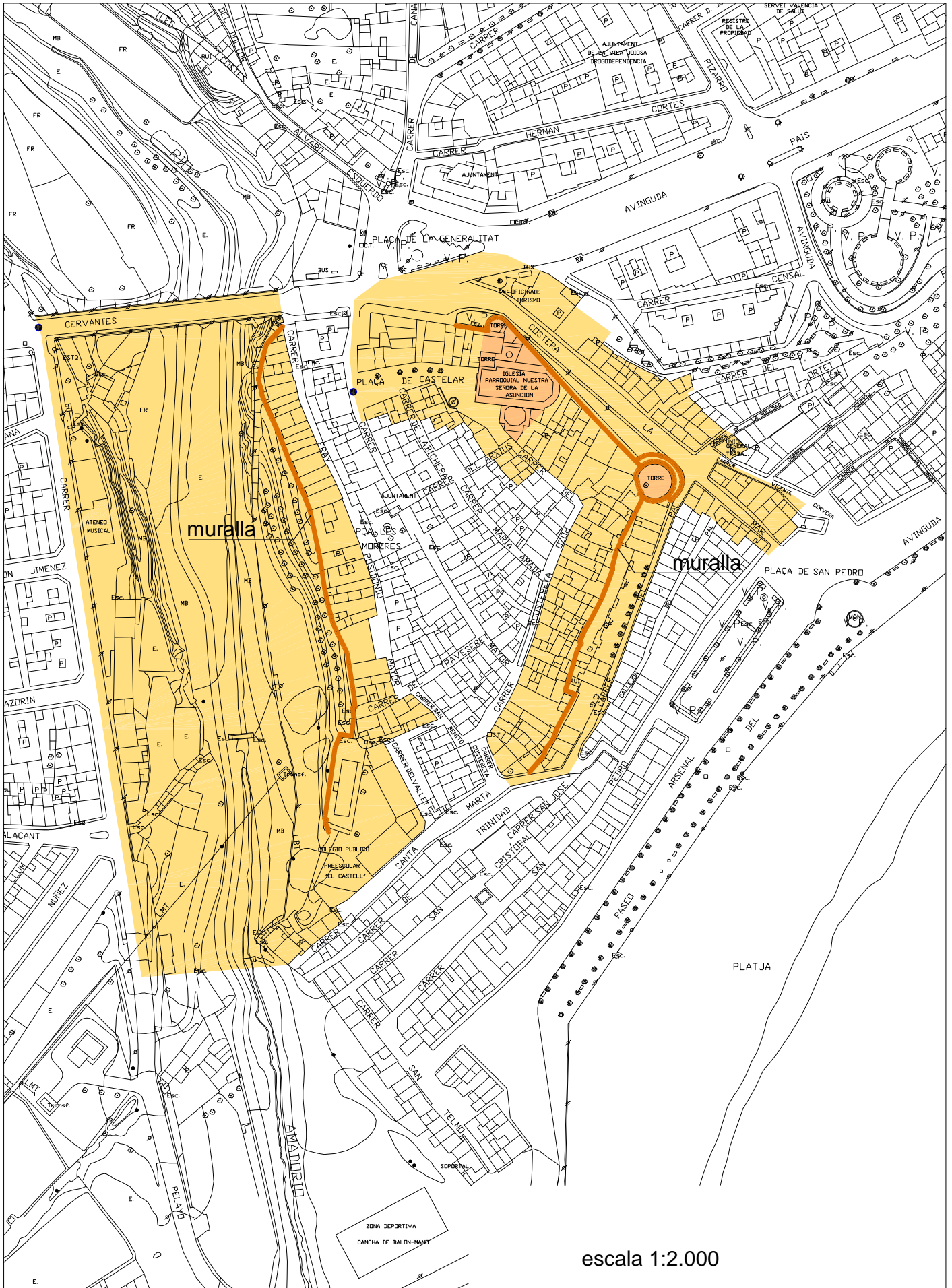
Delimitación entorno de protección del recinto amurallado e Iglesia fortificada de la Asunción de Nuestra Señora