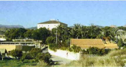
CONJUNTO ARBÓREO Y VÍA PECUARIA