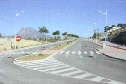
PUNTO DE OBSERVACIÓN_01