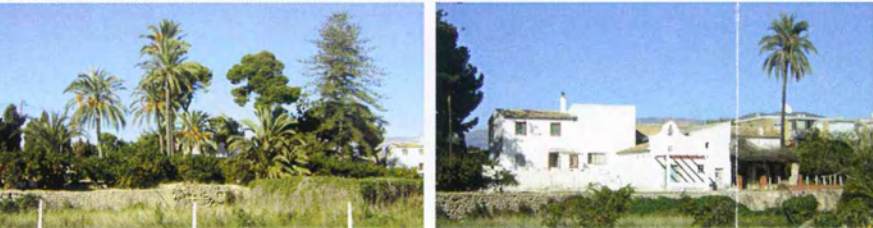
CONJUNTO ARBÓREO Y BIEN DE RELEVANCIA LOCAL