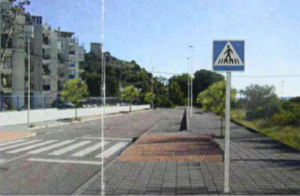
PUNTO DE OBSERVACIÓN_04