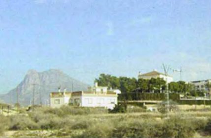
PUNTO DE OBSERVACIÓN_03