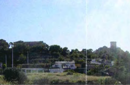
PUNTO DE OBSERVACIÓN_02